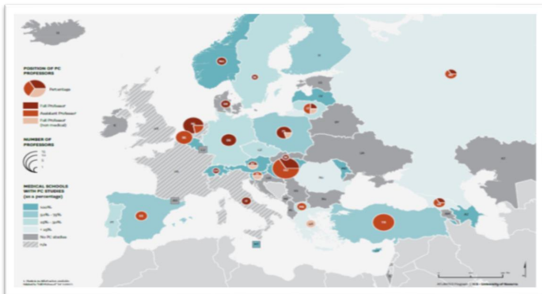
Abbildung 1. EAPC Atlas zu Palliative Care – Studentische Lehre.

Innerhalb Europas fällt ein erheblicher Unterschied in den Anforderungen der studentische Lehre für Palliative care auf. Der EAPC Atlas zu Palliative Care von 2013 zeigt außerdem, dass in 32% der Ländern nicht einmal irgendein Kurs zu Palliative Care angeboten wurde [10] (Abbildung 1).